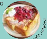
@eloisescafe_nagoya HISAYA歴: 2年

モーニング、ランチ、カフェ、ディナー、テイクアウトで、女性を中心にさまざまなお客様が来店されて、テラス席ではワンちゃん連れもOK。園内で四季を感じて、メニューでも季節感を味わえるように、毎月1日に月替わりのスペシャルメニューを発表します。9月は2周年記念で、エッグベネディクトの新作「雪崩ベネディクト」と「まるごとメロンのフレンチトースト」を特別価格で提供。毎回スペシャルをお目当てに利用されるご近所のリピーター様と、お話しするのが楽しいです。今後は店舗同士がつながり、みんなで公園を盛り上げる企画をやりたいですね。TEL 052-211-9292 8:00~21:30 土・日・祝9:00~21:30