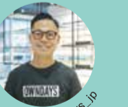
@owndays_ib HISAYA歴: 2年

園内で季節の変化やまちのトレンドに触れながら、接客に時間をかけて一人ひとりと向き合い、メガネやサングラスの選び方をお伝えしています。公園を楽しみに来られているお客様が多く、飲食のついでやYouTube・TikTokを見てという方、近隣で働く方、著名人まで多彩です。全世界13カ国・地域で450店舗以上を展開するブランド(オンデイズ)を知っていただくため、僕たちが日々やっているのは「お客様に満足して帰ってもらう」ということだけ。目の疲れなどのお悩みをレンズで解決し、ご購入後の「良かったよ」の一言がうれしいです。TEL 0120-900-298 11:00~20:00