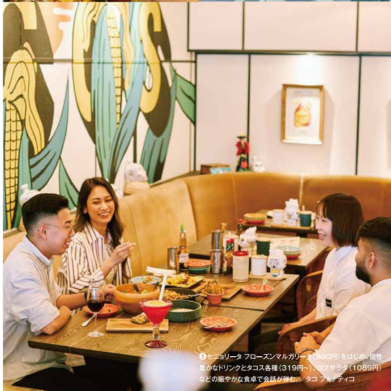
⑦ セブソーラータ フローズマルガリータ(980円)をはじめ、個性豊かなドリンクとタコス各種(319円~)、コブサラダ(1089円)などの賑やかな食卓で会話が弾む。タコフアナティコ