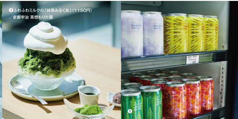
③ ふわふわミルクの「抹茶みるく氷」(1150円) / 京都宇治 茶想もりた園