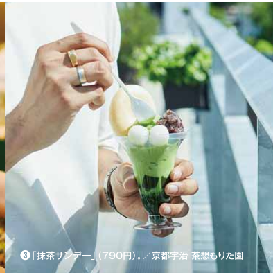
⑤ 「抹茶サンデー」(790円) / 京都宇治 茶想もりた園