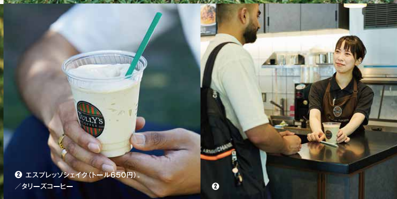
② エスプレッソシェイク(トール650円) / タリーズコーヒー