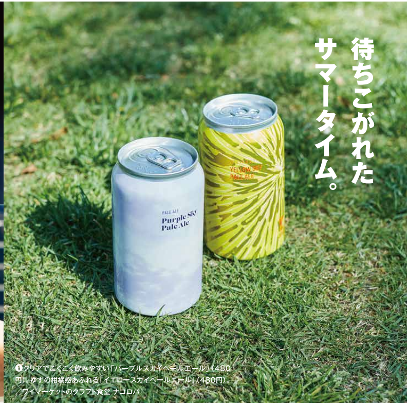
① クリアでこくよく飲みやすい「パープルスカイパールエール」(480円)・ゆずの柑橘感あふれる「イエロースカイパールエール」(490円) / ワイマーカーットのクラフト食堂 ナゴロバ