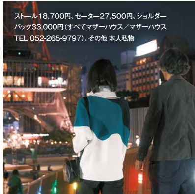
ストール18,700円、セーター27,500円、ショルダーバッグ33,000円(すべてマザーハウス/マザーハウス TEL 052-265-9797)、その他 本人私物