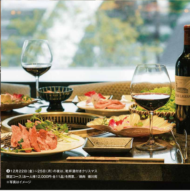
③ 12月22日(金)~25日(月)の夜は、乾杯酒付きクリスマス限定コース(お一人様12,000円-全11品)を用意。/ 焼肉 徳川苑 ※写真はイメージ