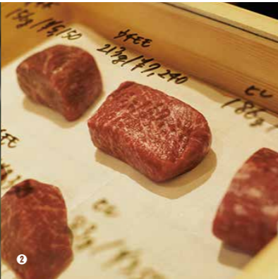
② 京都の名店出身の料理長のこだわりメニューと、厳選して仕入れた国産和牛の薪焼き肉に合わせて、月替わりのワインを提案。/ Arcoba