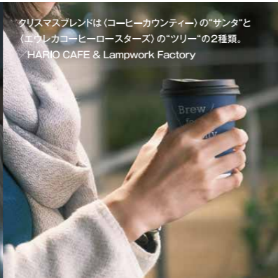
クリスマスブレンドは(コーヒーカウンティ)の「サンタ」と(エウレカコーヒーロースターズ)の「ツリー」の2種類。HARIO CAFE & Lampwork Factory