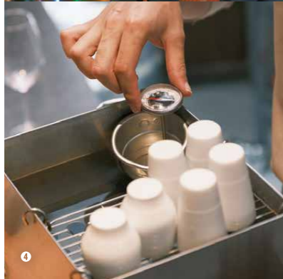
④ 「明眸」(1合825円)をゆる燗で、米のうま味が乗って、「嫁のたたき」(990円)のしっかりとした赤身の味わいが増す。/ 糀MARUTANI